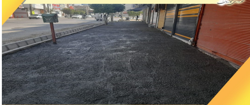
بتن ریزی و تسطیح پیاده رو خیابان شهدای جنوبی