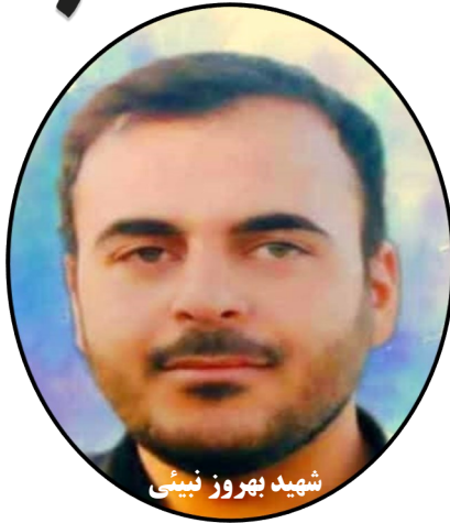
شهید بهروز نبیئی

آسفالت معابر، اجرای کانال اصلی سیل بر جنوب شهر، کانال سیل برواق در حد شرقی خیابان شهیدبراتی و کانال سیل برواق در خیابان شقایق، اجرا و اصلاح شبکه آبرسانی فضای سبز در بلوار پردیس و بلوار شهید سلیمانی، اجرای رفوژ وسط خیابان شهید کوهنورد و بخشی از خیابان شهید براتی، محوطه سازی و موزاییک فرش پیاده رو میدان فردوسی، زیرسازی و کانیوگذاری کوچه های جنب بوستان رفیع، بهسازی پارک های سلمان، طالقانی، بناها، بنفشه، مردانی، رفیع، بعثت، سه هکتاری پردیس، بانوان و... در حال اجرا است.