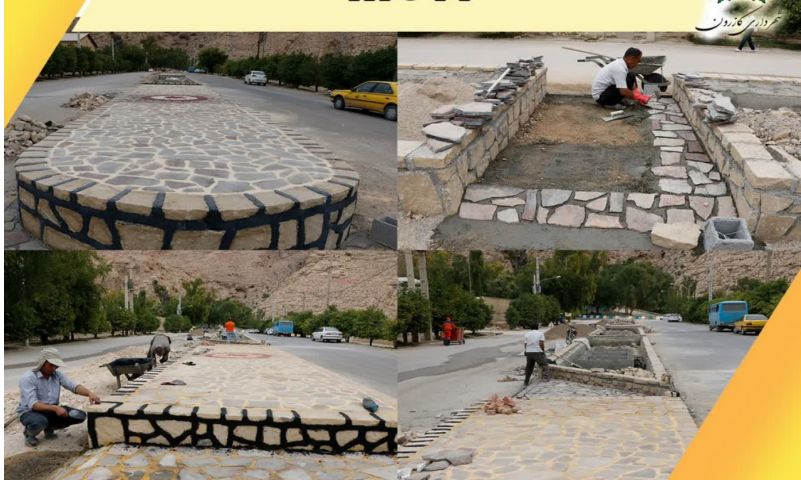
اجرای نمای بدنه و سنگ فرش رفوژ وسط خیابان آبشار