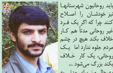
شهید علی اکبر پیرویان

در تاریخ ۱۳۳۸ در شهرستان کازرون پا به عرصه وجود گذاشت تحصیلات خویش را تا دوره راهنمایی در نورآباد و دبیرستان را در کازرون گذراند از همان کودکی عشق به خداوند در فطرت و سرشش گنجانیده شده بود و از سال ۵۲ شروع به فعالیت سیاسی مذهبی از طریق روزنامه دیواری کرد. در سال ۵۵ هنگام تحصیل در کازرون با فرستادن کتابها و نشریات و اعلامیه‌های ضد رژیم برای دوستان خود به فعالیت خویش ادامه داد. در تاریخ ۲۴/۱۲/۵۶ در سالروز تولد رضاشاه که جشن گرفته بودند او مشغول تخریب مراسم چراغانی و پخش اعلامیه امام خمینی پرداخت که هنگام سوزاندن عکس شاه جلو مدرسه حکمت مورد تعقیب مأموران قرار گرفته و در اثر تیراندازی مأموران بازوی چپ او مورد اصابت قرار می‌گیرد و پس از