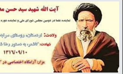
آیت الله شهید سید حسن مدرس

عصر استبداد و سیاهی معرفی شده جای تامل و تفکر دارد. لایب او با همین وضع جسم نحیف و به همان لباس پاک و مندرس که لباس بیشتر اولیا الله و هرآن خدا بوده و هست فرد یا نماینده اثر گذار زمانه خود و مدافع منافع ملی بوده است. اما ای مجلس و مجلسیان ما امروزه اینچنینند؟ مجلس باید قوی و پیشرو و کارآمد باشد. ایران قوی در سایه دولت و مجلس قوی و نیروهای مقتدر معنا و مفهوم دارد. در تمام ادوار مجلس گذشته و حال که بنگریم مردم منافعی از این نهاد قانون گذاری برده و میبرند و در عین حال مشکلاتی ازبابت همین ارکان حکومتی برایشان پیش آمده است. امام خمینی رحمت الله علیه مجلس را [عصاره فضایل ملت] دانسته اند. حقاً و انصافاً هم مینور باید باشد. باید سواد ترین و مطلع ترین افراد از مشکلات مردم و مسائل کشور به مجلس راه یابند. نمایندگانی پاکدست و بی حاشیه که اهل زد و بند و رانت بازی و پارتی بازی و گسترش تبعیض باشند و موجب بی اعتمادی مردم و نومیودی نسل جوان و نخبگان کشور نگردند. اما امروزه چنین نمایندگانی در مجلس ما حتی مجلسی که عنوان انقلابی دارد کم هستند. مجلس باید قدرتمند باشد و درست و به موقع تصمیمات مهم حکومتی را بگیرد. مجلس قدرتمند یار و یاور رهبری و امید کارگزاران ملت است اما مجلسی که