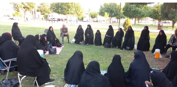
دیدار با امام جمعه با حضور دکتر امیر حسین ثابتی نماینده مجلس