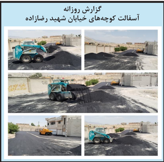
گزارش روزانه آسفالت کوچه های خیابان شهید رضازاده

شهردار کازرون در بازدید از پارک آزادی کمپوهای این پارک را مورد بررسی قرار داد. به گزارش روابط عمومی شهرداری کازرون، مهندس رضا نوذری شهردار کازرون، معاون خدمات شهری شهرداری و مسئول عمران شهرداری به صورت میدانی از پارک آزادی بازدید کردند. همچنین تعدادی از شهروندان ساکن در این منطقه حضور داشتند و مسائل و مشکلات خود را با شهردار در میان گذاشتند. در ادامه شهردار کازرون، دستورات لازم را در خصوص رسیدگی و برطرف کردن مشکلات این پارک دادند.