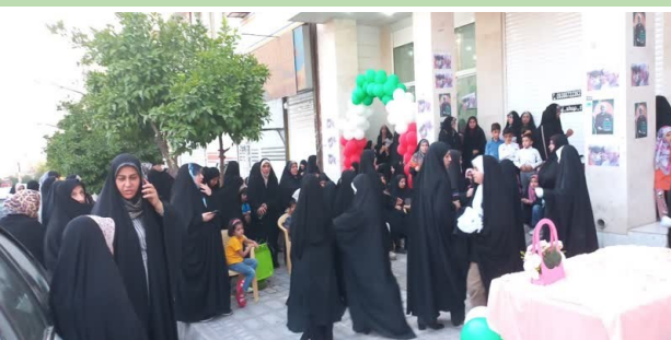
جلسه با خواهران در پارک آزادی

افتتاح ستاد خواهران دکتر جلیلی در شهرستان کازرون