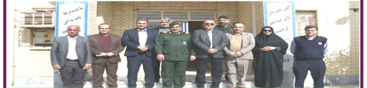
به گزارش روابط عمومی شهرداری کازرون، همزمان با اعیاد شعبانیه و فرارسیدن روز پاسدار، شهردار، اعضای شورای اسلامی شهر، معاون خدمات شهری، سرپرست سازمان مدیریت حمل و نقل و سرپرست سازمان آتش‌نشانی و خدمات ایمنی، با سردار فریدونی، فرمانده تیپ تکاور امام سجاد (ع) دیدار و روز پاسدار را نیز به وی و دیگر پاسداران انقلاب اسلامی تبریک گفتند.