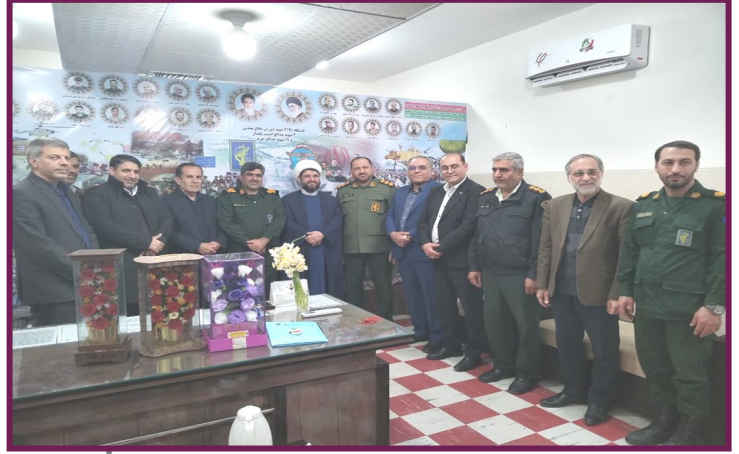
دیدار شهردار و اعضای شورای اسلامی شهر کازرون با فرمانده تیپ تکاور امام سجاد (ع) به مناسبت روز پاسدار

در ادامه، فرمانده تیپ تکاور امام سجاد (ع) و فرمانده آمادگاه شهید چمران ضمن تشکر از حضور مسئولان شهرستان، گفتند: سنگ‌های اصلی نظام، مدارس و دانشگاه‌ها و دیگر دستگاه‌ها هستند، سهم ما متفاوت است، اما وظیفه همه، خدمت در مسیر حفظ نظام مقدس جمهوری اسلامی است. آن‌ها تأکید کردند: پاسدار بودن تنها به پوشیدن لباس خلاصه نمی‌شود، همه ما پاسدار نظام هستیم، هرچند وظایف و مسئولیت‌ها متفاوت است، اما مسیر خدمت و اعتقاد یکی است.