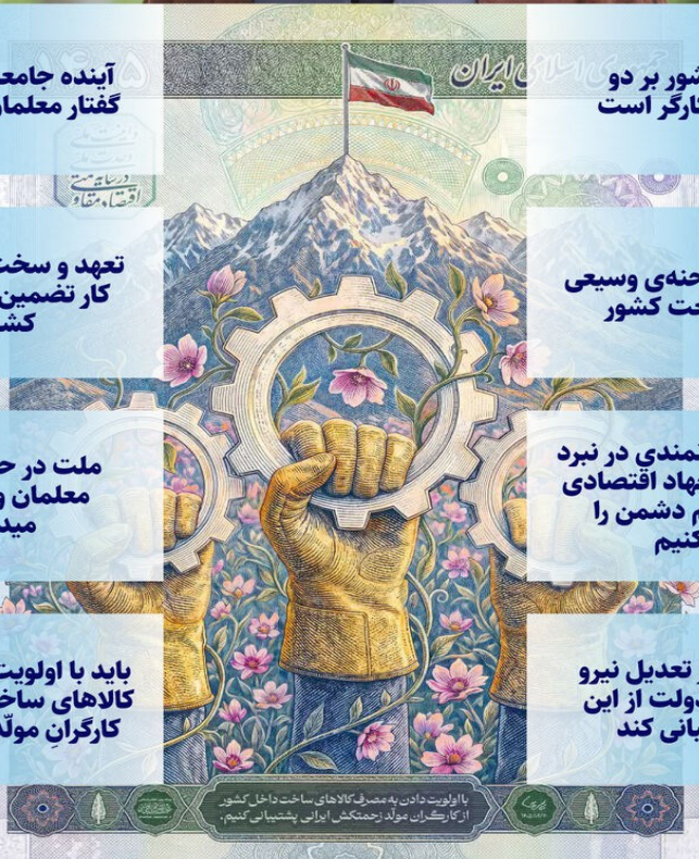
با اولویت دادن به مصرف کالاهای ساخت داخل کشور از کارگران مولد زحمتمکش ایرانی پشتیبانی کنیم.

کسب‌وکارها از تعدیل نیرو پرهیز کنند و دولت از این عمل پشتیبانی کند